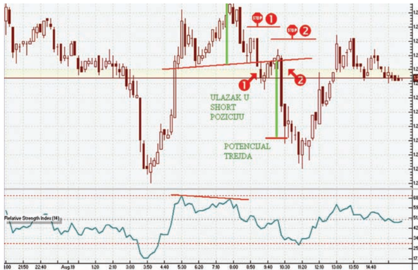
Slika 2 – Snimak ekrana sa označenim karakterističnim figurama