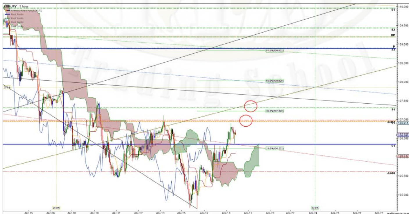
EUR/JPY Important zones