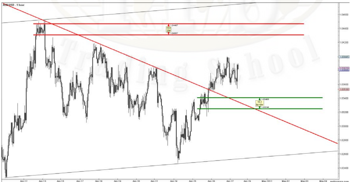
AUD/USD Supply/Demand levels