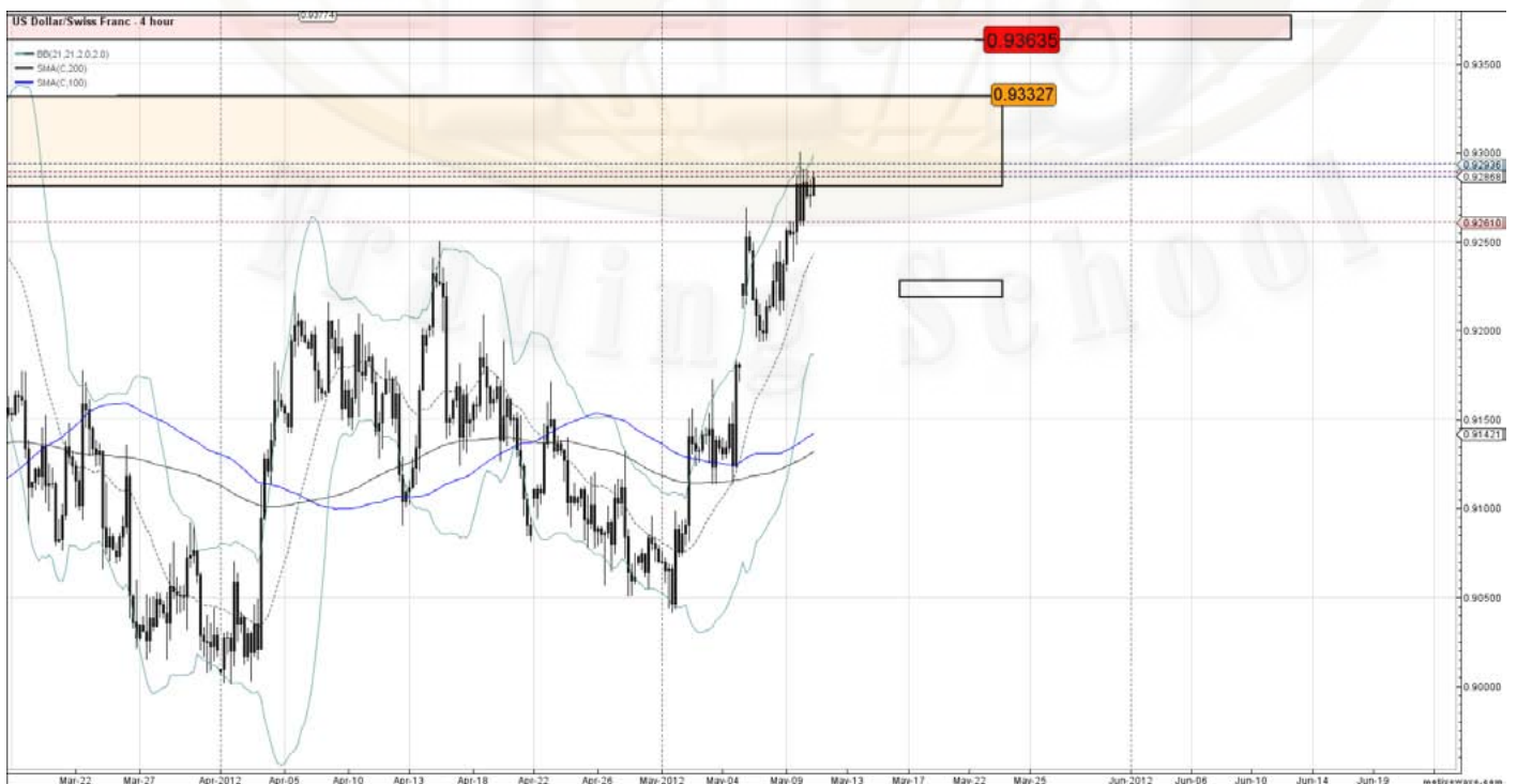
USD/CHF 4Hour chart sell zones