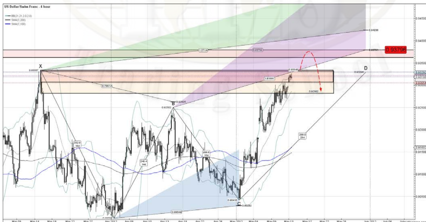
USD/CHF 4Hour Gartley and Sell zones